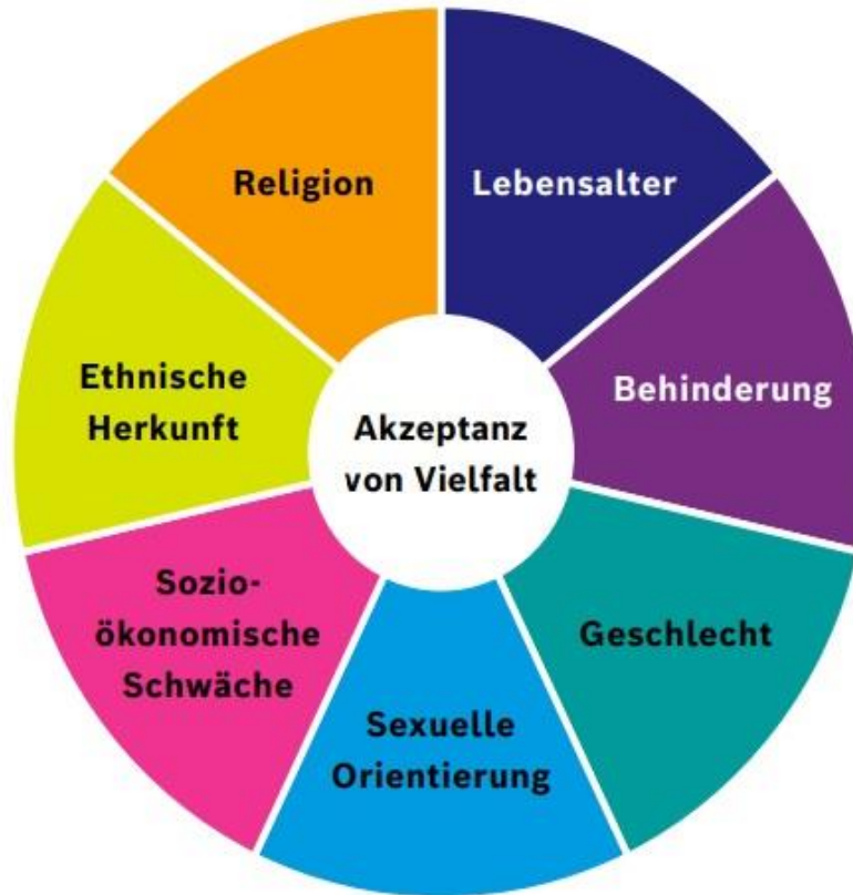
Abbildung 1 → Der Vielfaltsindex und seine sieben Dimensionen